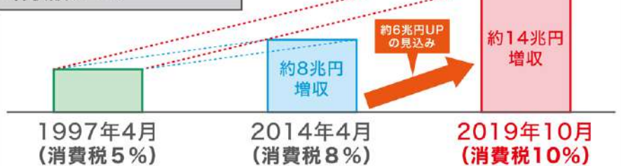
消費税5%の時と比べた増収額グラフ