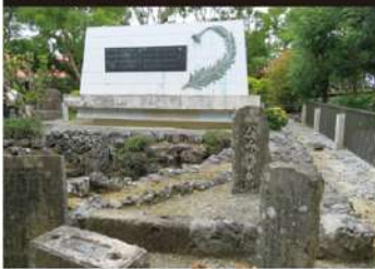
沖縄県内には400以上の慰霊塔(碑)が建立されている