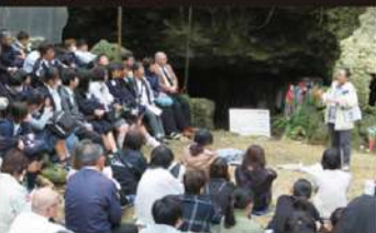
沖縄戦時に集団自決が行われた場所