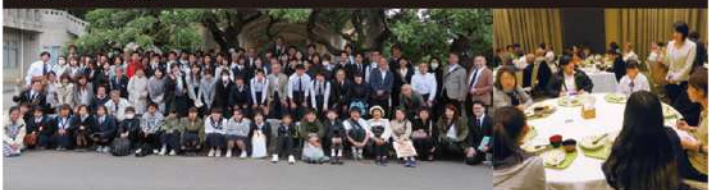
静岡県内の中学生から大学生を中心とした皆様と沖縄戦跡を巡る平和学習の旅