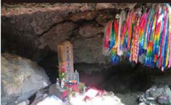
ひめゆり学徒隊などが配属された南風原陸軍病院の分室となった場所