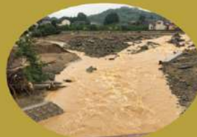
近年日本でも毎年のように、 大型台風やゲリラ豪雨など全国 各地で大規模な災害が発生。

環境化学の用語の一つ。何かを生産したり、一連の人為的活動を行った際に、 排出される二酸化炭素と吸収される二酸化炭素が同じ量である、という概念。