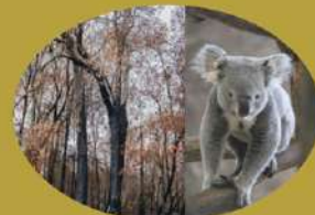
オーストラリアでは大規模な森林 火災が発生し多くのコアラや カンガルーが犠牲となりました。

これらは、すべてではないにしろ地球温暖化が大きな 原因となっている可能性が高いと言われています。